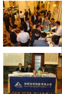
赞助商展位人气聚集，众多参会嘉宾前来咨询、讨论