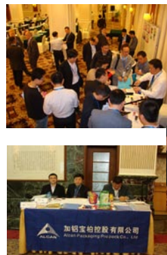
赞助商展位人气聚集，众多参会嘉宾前来咨询、讨论